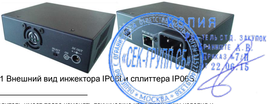
Рис.1 Внешний вид инжектора IP06I и сплиттера IP06S.