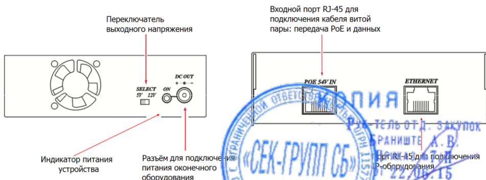
Рис.4 Разъёмы сплиттера IP06S.